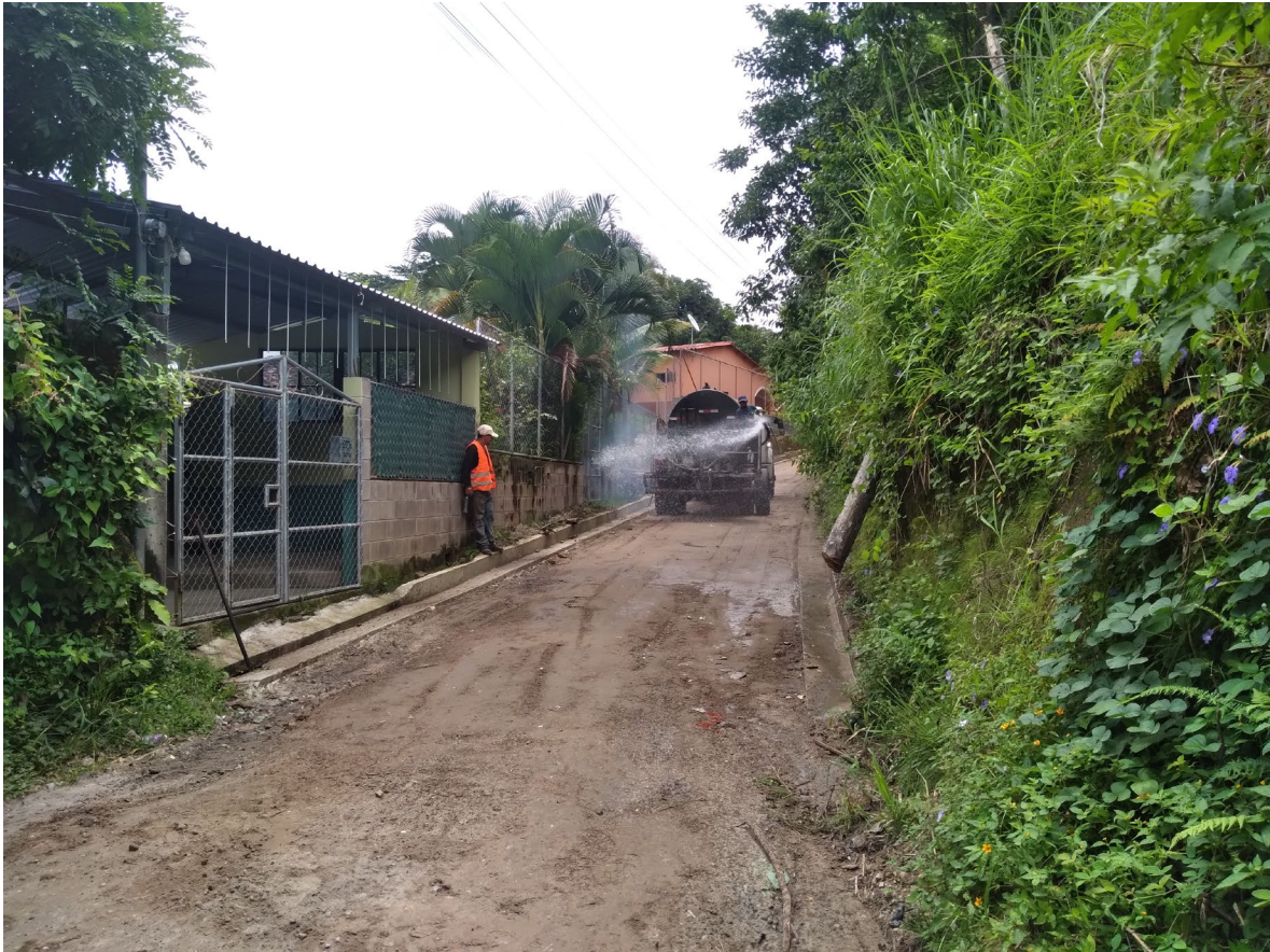
REGADO DE LA BASE, PREVIA COLOCACION DE LA BASE DE MEZCLA ASFALTICA.