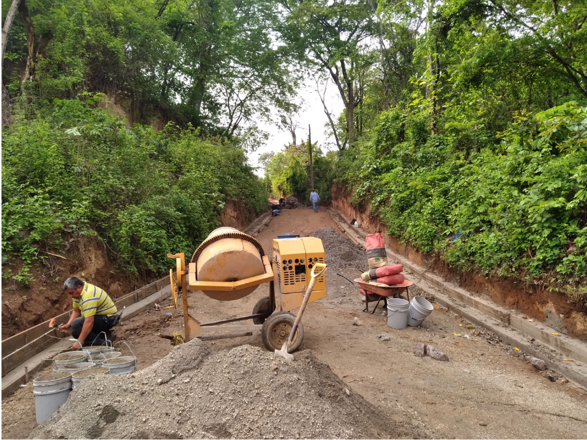
CONSTRUCCION DE CORDON CUENTA CON MAMPOSTERIA DE PIEDRA.