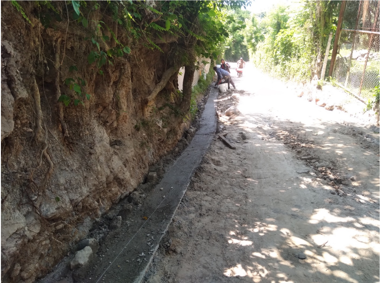
CONSTRUCCION DE CAMA DE AGUA CON EL PROCESO DE MAMPOSTERIA DE PIEDRA.