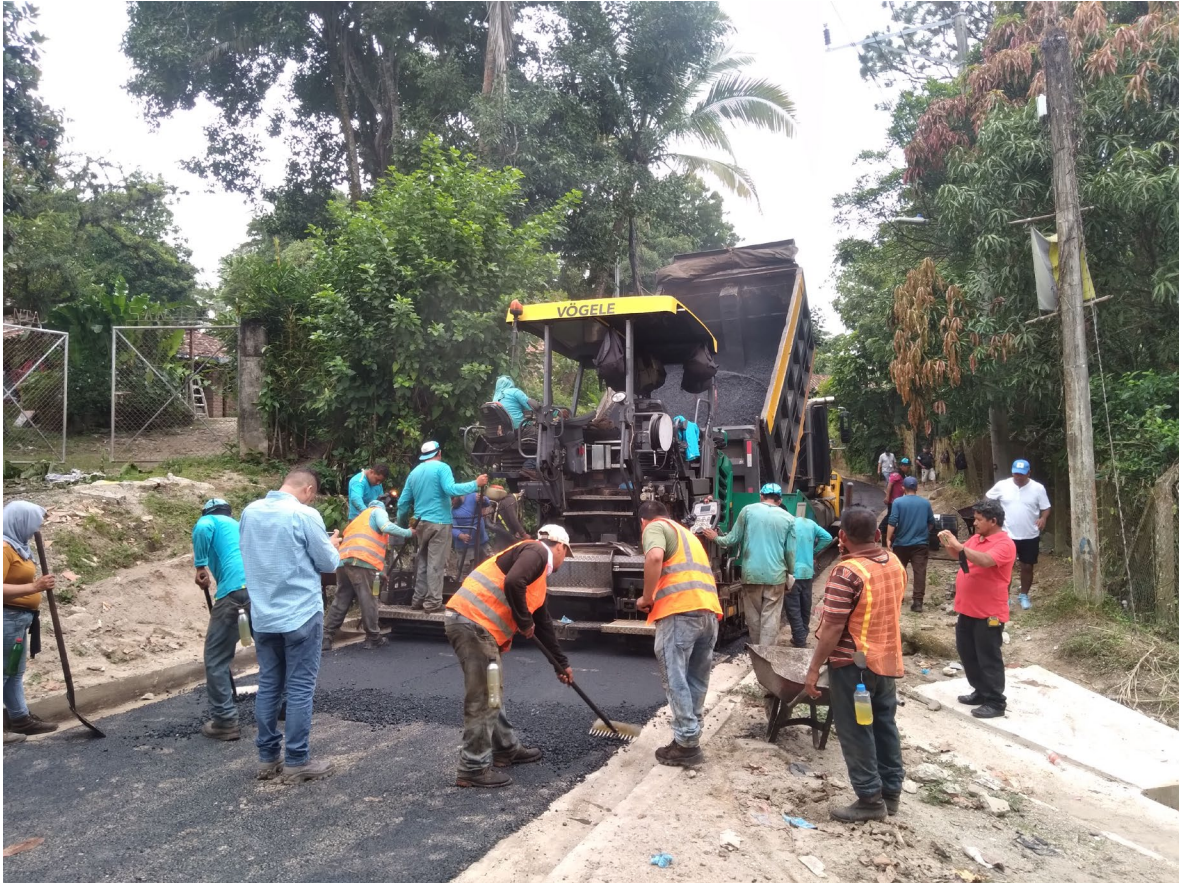
COLOCACION DE MEZCLAS ASFALTICA EN CALIENTE