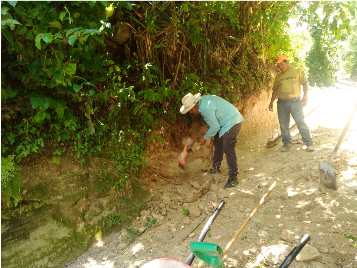
EJECUCION DE LA CALLE DE ACCESO A CASERIO LOS MAZARIEOS.