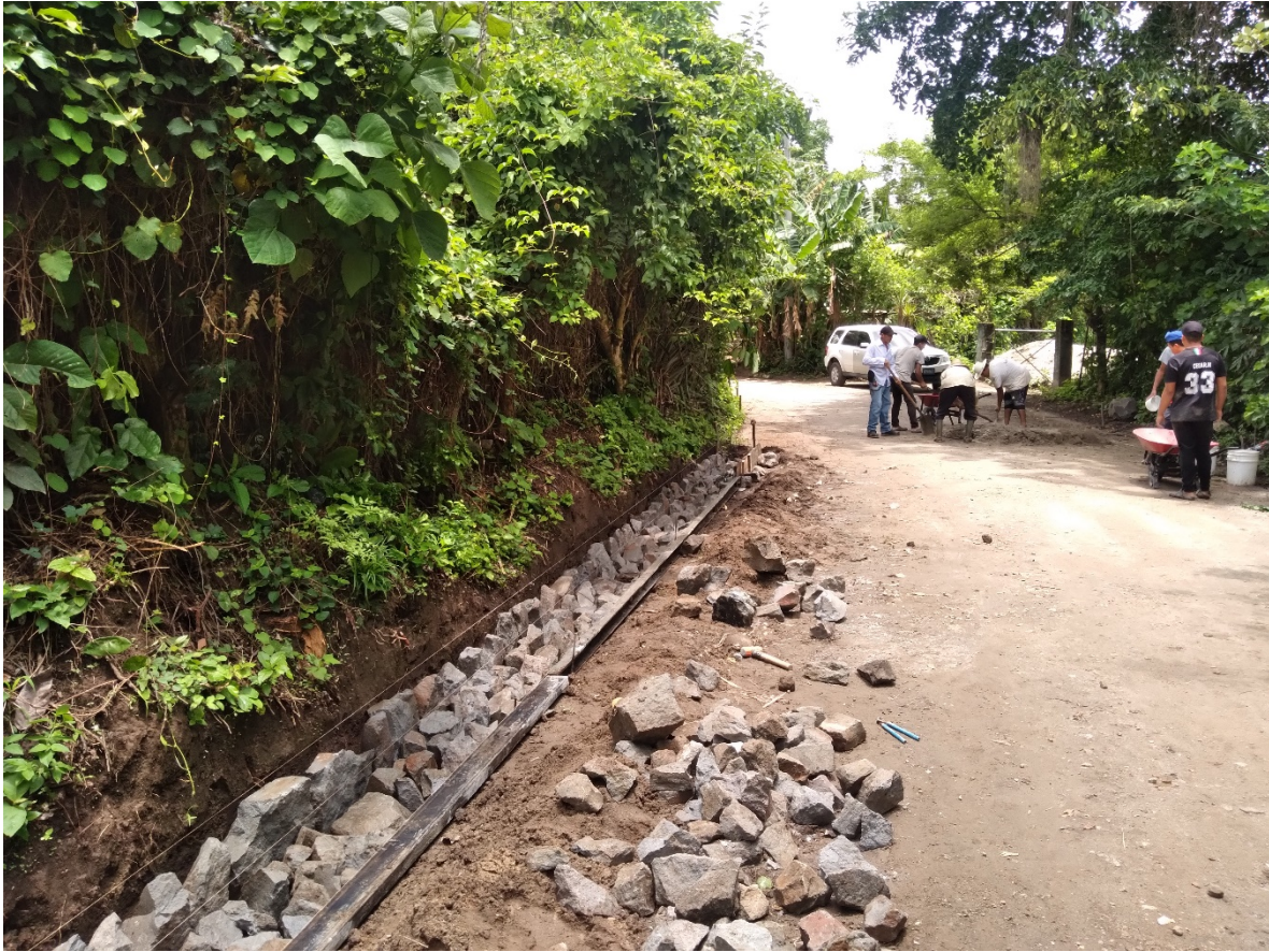
CONSTRUCCION DE CORDON CUNETA CON MAMPOSTERIA DE PIEDRA.