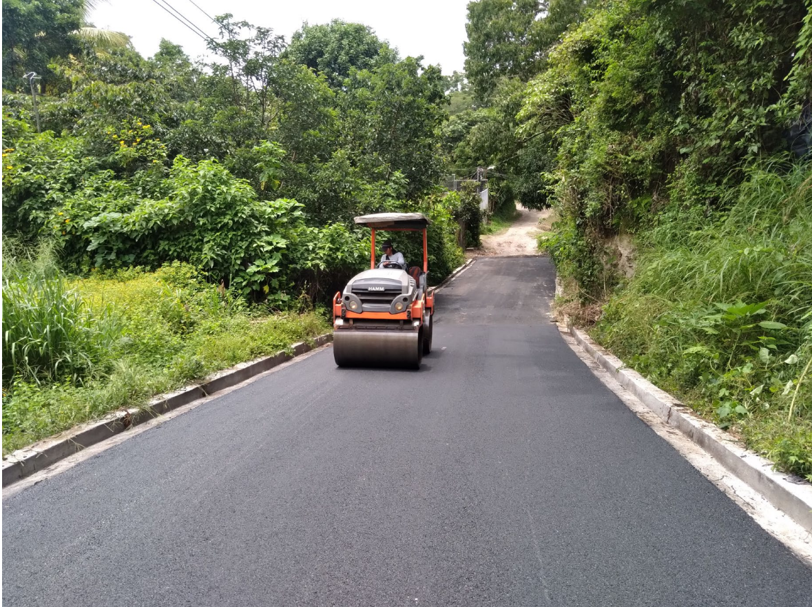
Ç COLOCACION DE MEZCLA ASFALTICA EN CALIENTE.