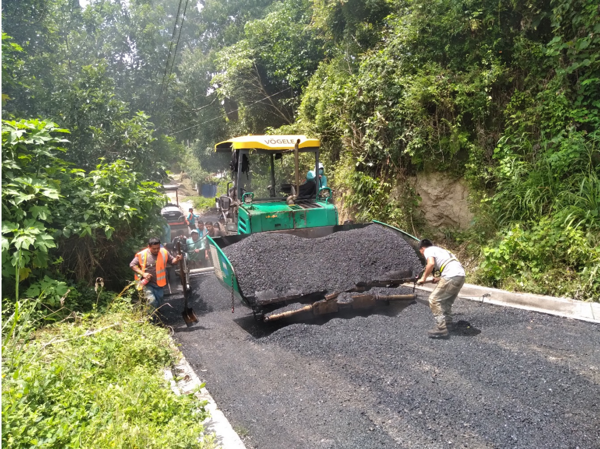
COLOCACION DE MEZCLA ASFALTICA EN CALIENTE.