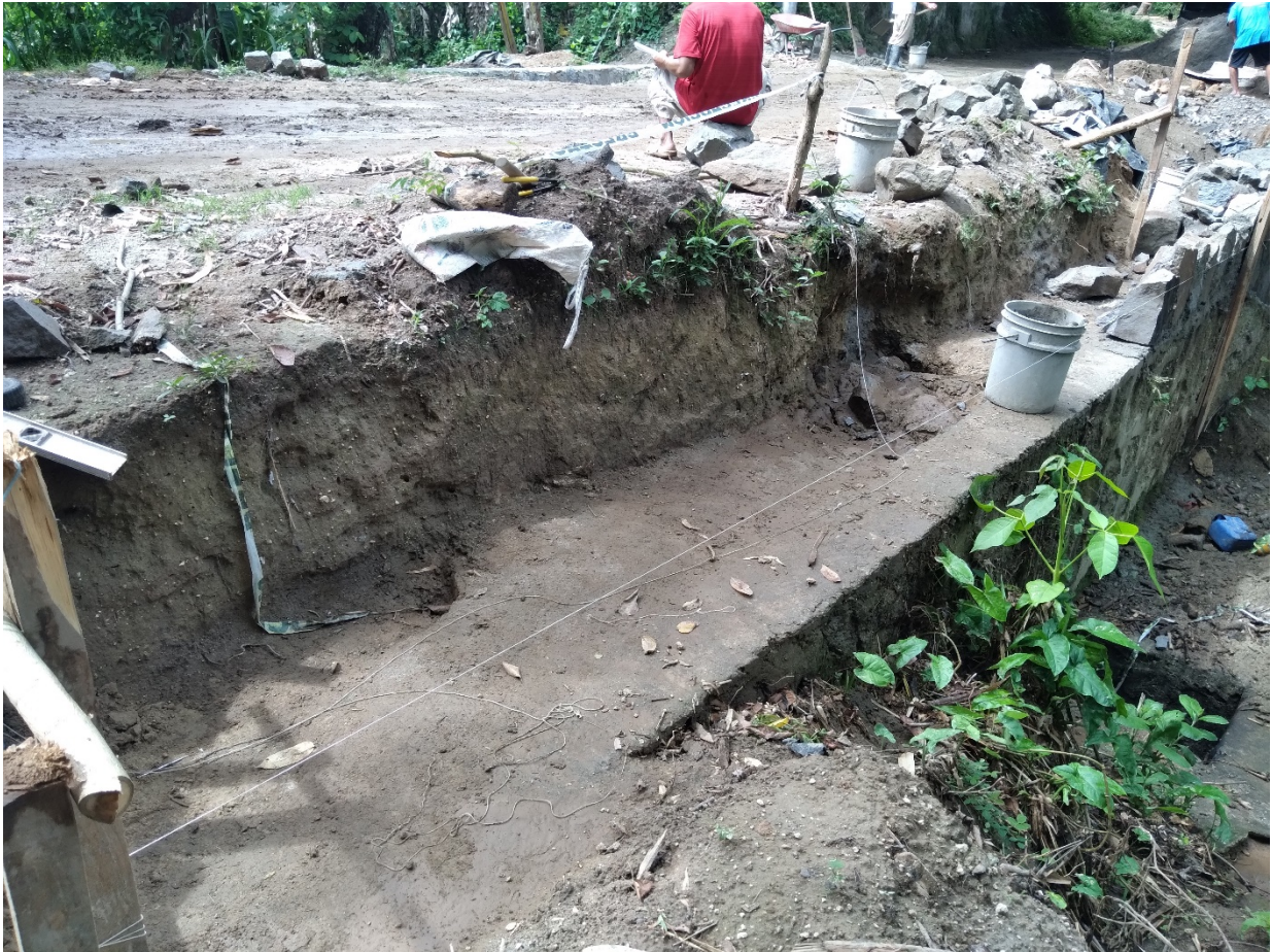
PROCESO DE FINALIZACION DE LACORONA DEL MURO EN EL COSTADO SUR.