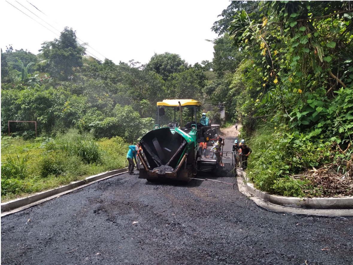
COLOCACION DE MEZCLA ASFALTICA EN CALIENTE.