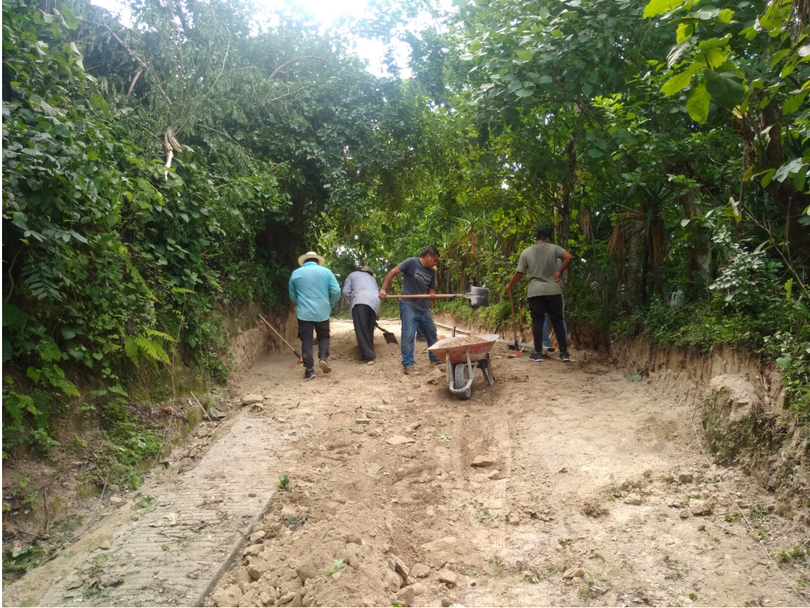
EJECUSION DE LA CALLE DE ACCESO A CASERIO LOS MAZARIEOS.