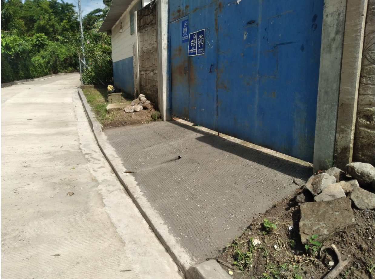
APOYO AL CENTRO ESCOLAR EN LA CONSTRUCCION DE LA RAMPA DE ACCESO.