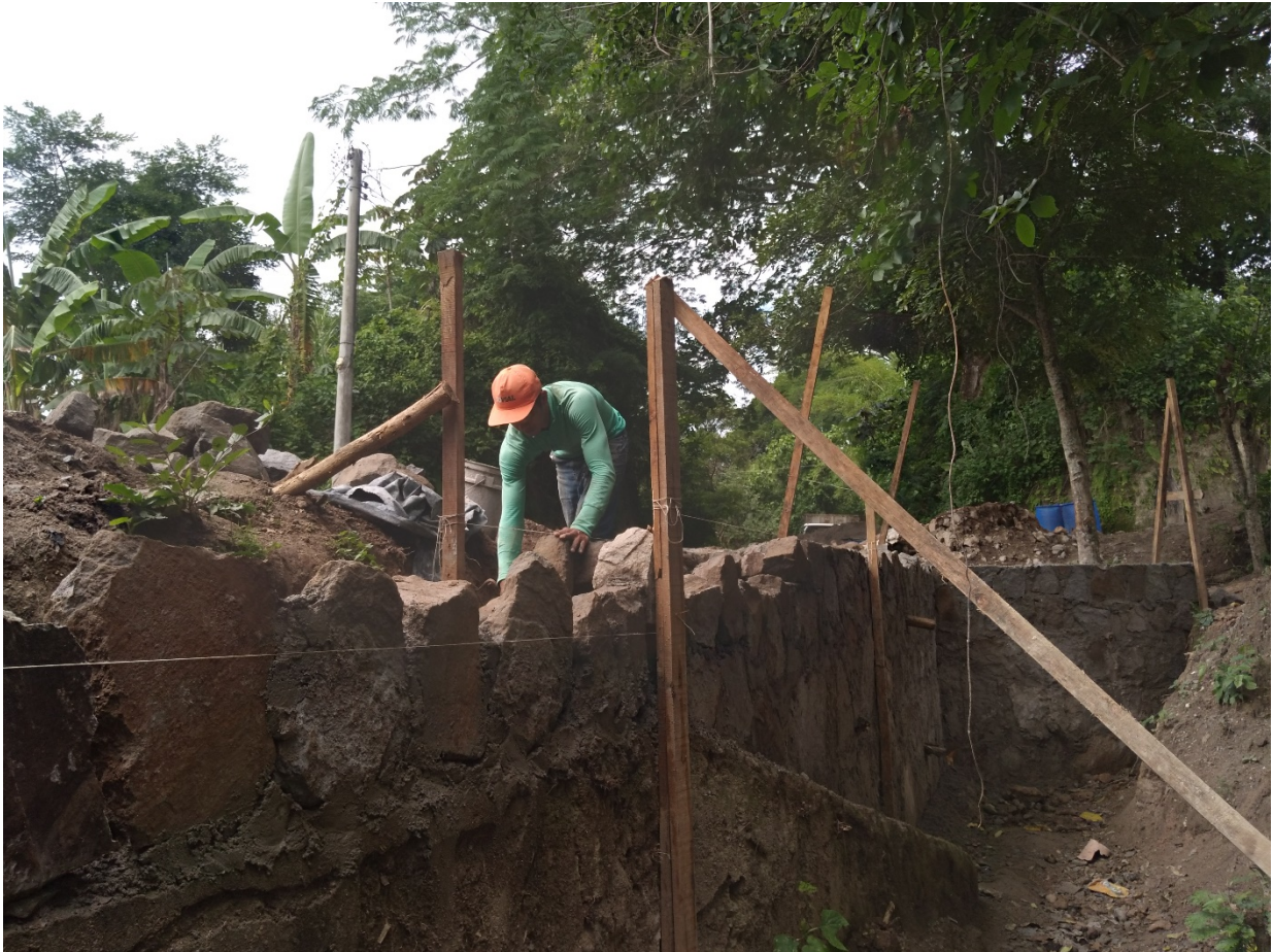
PROCESO DE FINALIZACION DE LACORONA DEL MURO EN EL COSTADO SUR.