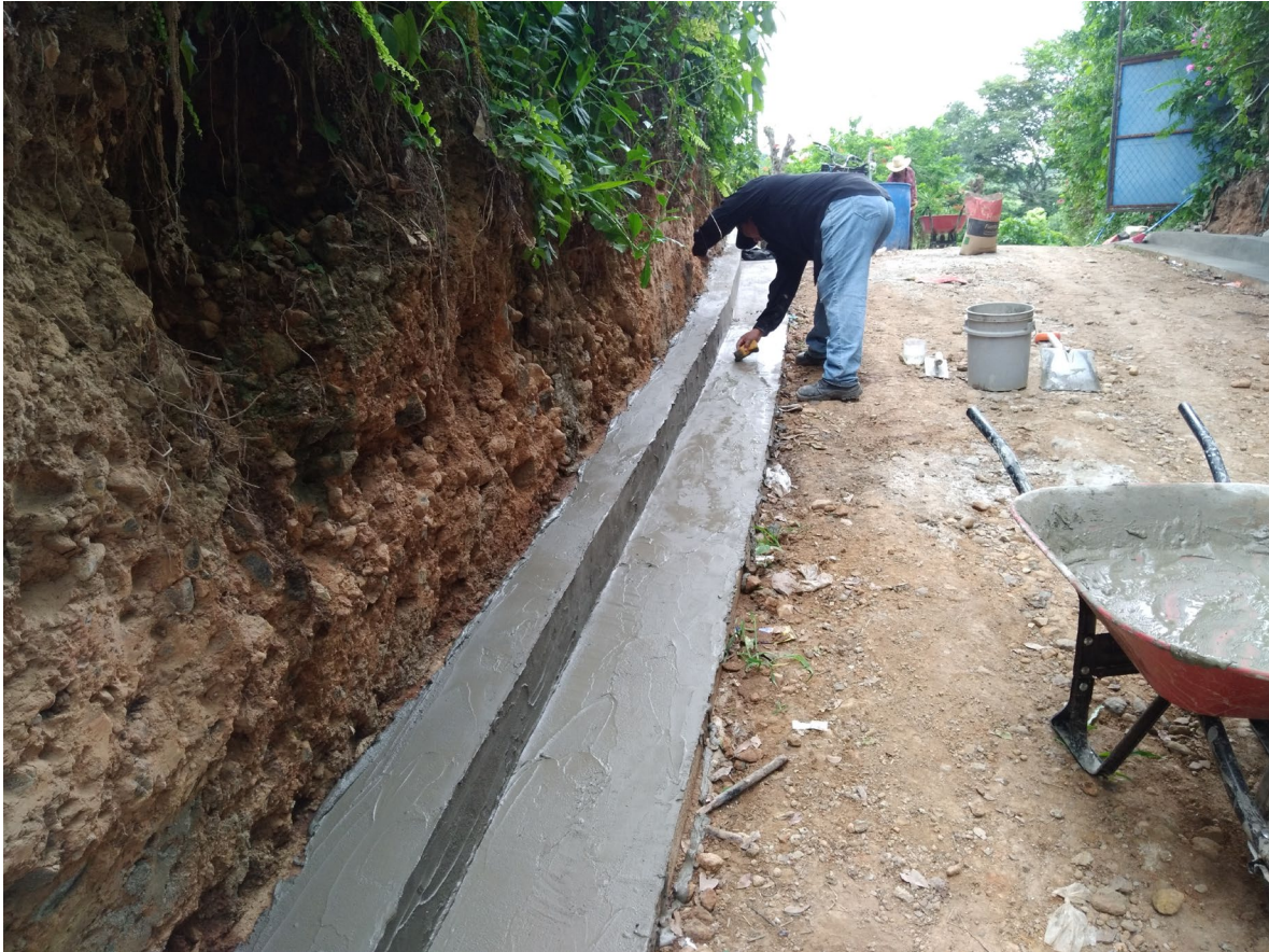
CONSTRUCCION DE CORDON CUENTA CON MAMPOSTERIA DE PIEDRA.