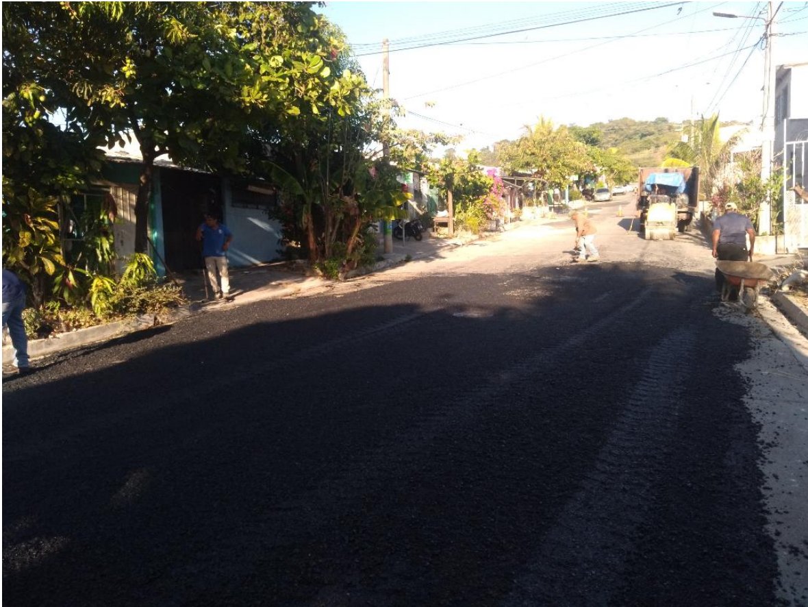
COLOCACION DE MEZCLAS ASFALTICA EN CALIENTE, EN CALLE EL ROBLE DE RESIDENCIAL CUMBRES DE SAN BARTOLO.