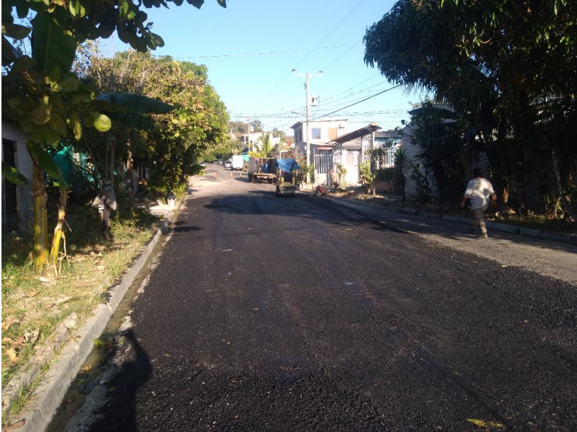
COLOCACION DE MEZCLAS ASFALTICA EN CALIENTE, EN CALLE EL ROBLE DE RESIDENCIAL CUMBRES DE SAN BARTOLO.