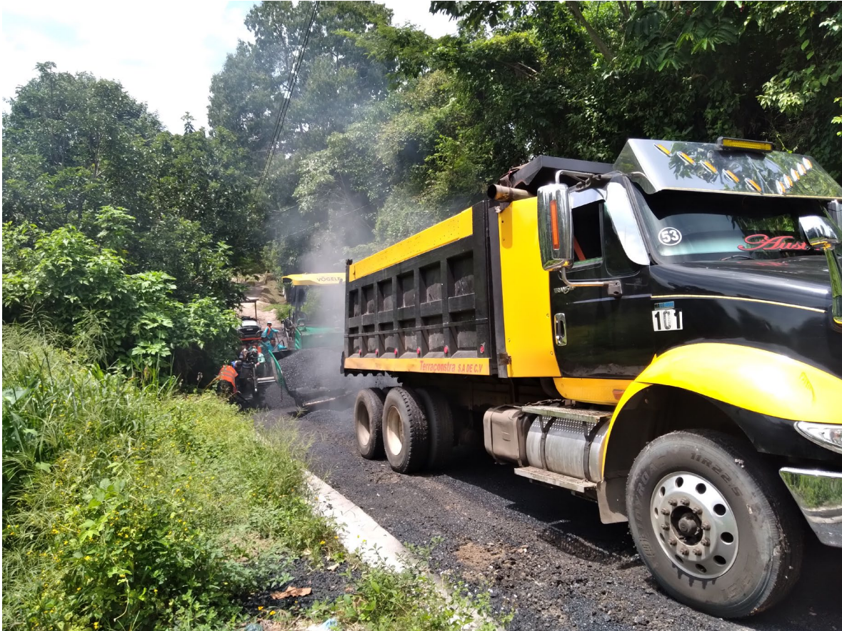
COLOCACION DE MEZCLA ASFALTICA EN CALIENTE.