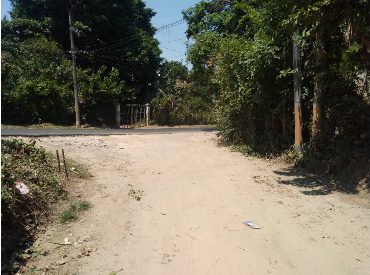
AREA DE ENTRADA AL CANTON EL SAUCE, LUGAR DONDE INICIA EL PROYECTO REALIZADO POR LA UNIDAD DE MANTENIMIENTO E INFRAESTRUCTURA.