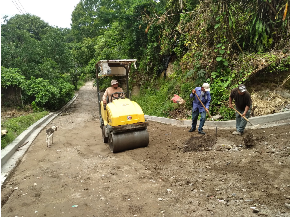
COMPACTACION DE LA BASE DE SUELO CEMENTO.