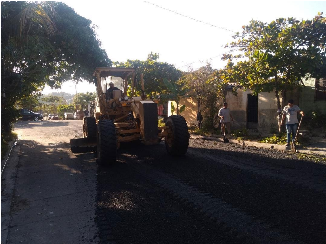
COLOCACION DE MEZCLAS ASFALTICA EN CALIENTE, EN CALLE EL ROBLE DE RESIDENCIAL CUMBRES DE SAN BARTOLO.