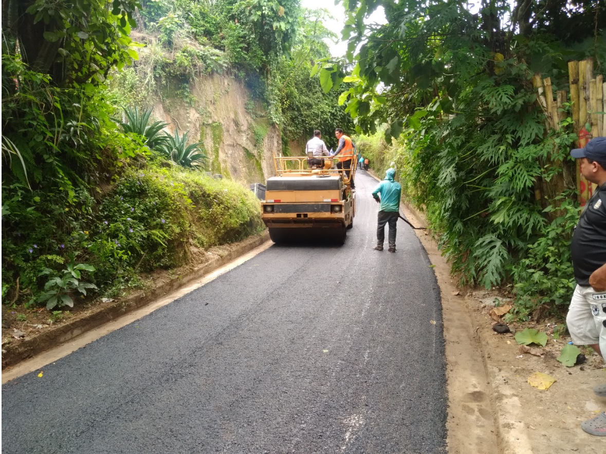
COLOCACION DE MEZCLAS ASFALTICA EN CALIENTE