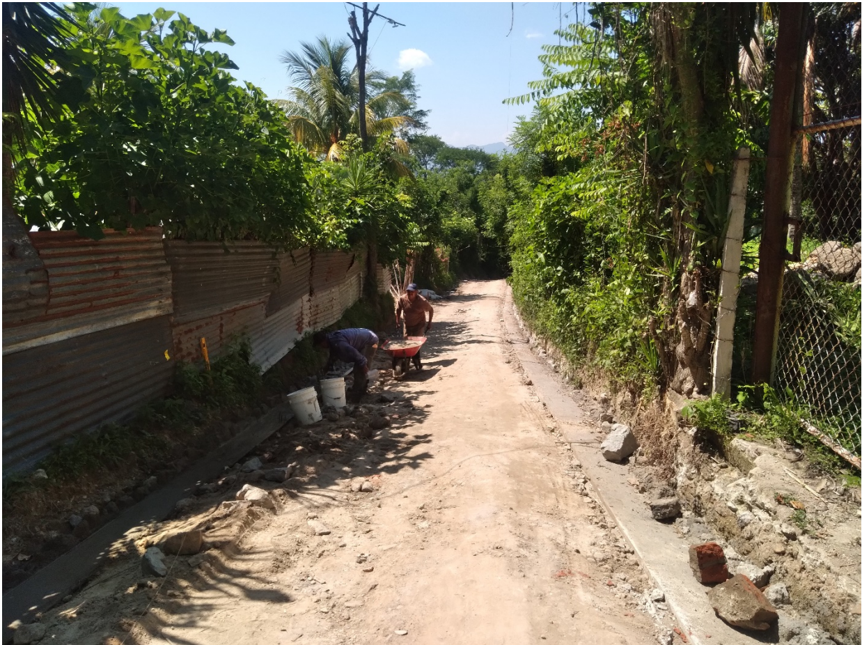
COLOCACION DE MORTERO COMO LIGANTE DE LA MAMPOSTERIA DE PIEDRA, PARA LA CONFORMACION DE LA CAMA DE AGUA.