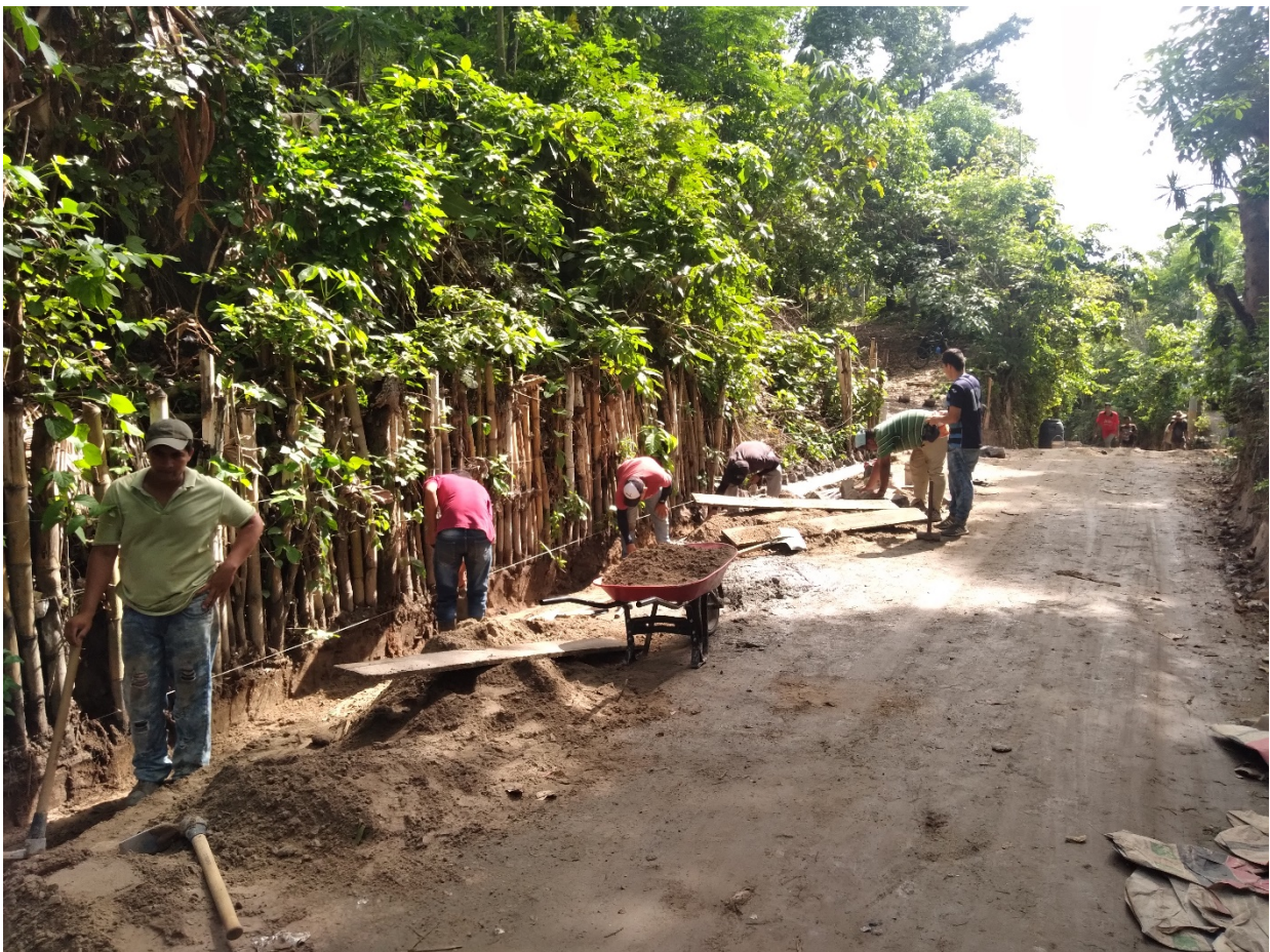
AVANCE DEL PROYECTO EN LA ESTACION 0+120 DE CONRDON CUNETA PROCESO DE EXCAVACION PARA LA FUNDACION DE LA CAMA DE AGUA.