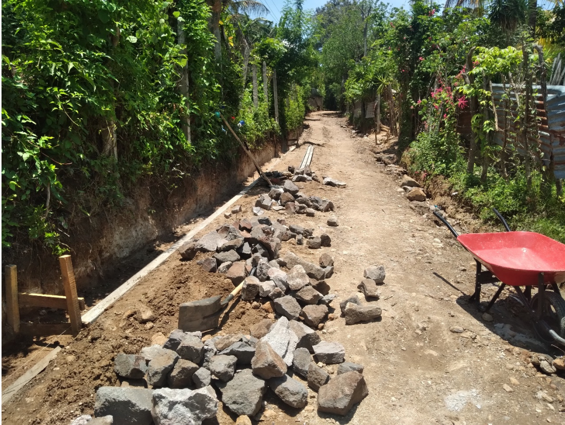
PROCESO DE ACARREO INTERNO DE PIEDRA PARA LA FUNDACION DE LA CAMA DE AGUA O CUNETETA.